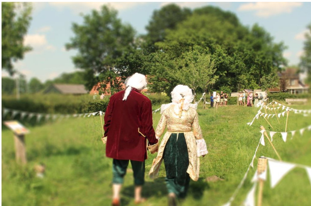
Performance in Dorpsboomgaard Lettele, als onderdeel van de Kunstfietsroute, 10 & 11 juli

*Op 10 en 11 juni 2023 is deelgenomen aan een fruitperformance in dorpsboomgaard Lettele tijdens de Kunstfietsroute. Inclusief de voorbereidende fruitverwerking met de kunstenaar en verschillende dorpingen.