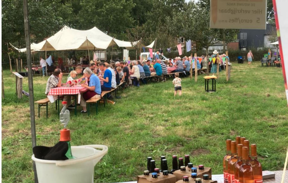
Oogstfeest en fruitdag in de Dorpsboomgaard Lettele, 23 september

*In samenwerking met werkgroep Dorpsbongerd Lettele is in september 2023 een (historische) fruit/oogstdag georganiseerd in de dorpsbongerd van Lettele. Bezoekers konden op de dag fruit laten determineren door een pomoloog.